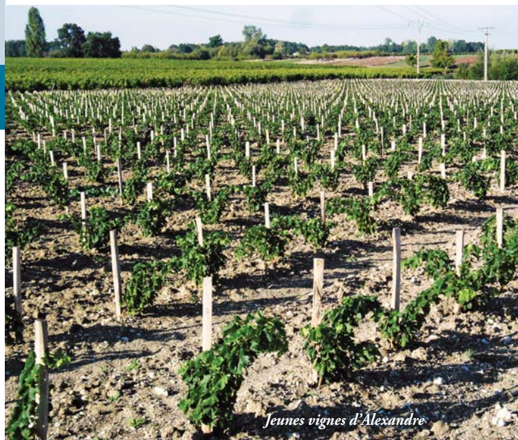
Jeunes vignes d'Alexandre

Vignobles situés à Cars, 45 kms au nord de Bordeaux, à 5 kms de Blaye, près de l'estuaire de la Gironde, face au Médoc.